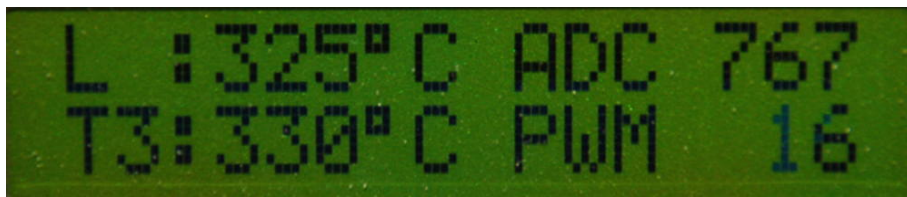
Ansicht des Displays. L=Lötkolbentemperatur, T3=gespeicherte Temperatur Taste 3, ADC=A/D Wandler 10Bit Wert Wertebereich 0..1023), PWM= Pulsweite Wertebereich 0..255.