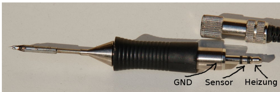
Ansicht des Lötkolbens.